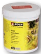
61130 Gras-Kleber 250 g