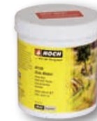
61130 Grass Glue 250 g