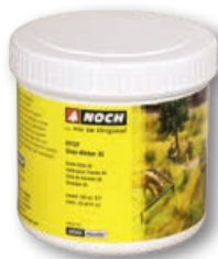
61131 Colla per erba XL 750 gr