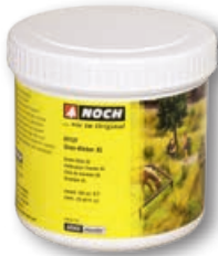
61131 Gras-Kleber XL 750 g