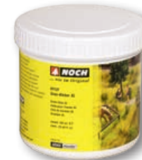
61131 Grass Glue XL 750 g