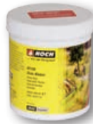
61130 Colla per erba 250 gr