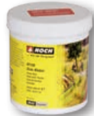
61130 Gras-Kleber 250 g