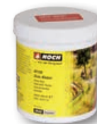
61130 Graslijm 250 g