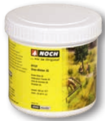
61131 Gras-Kleber XL 750 g