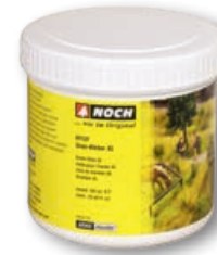
61131 Graslijm XL 750 g