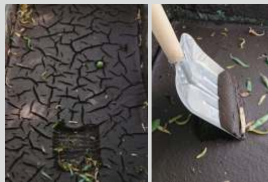
Odvodněný kal v rypném stavu