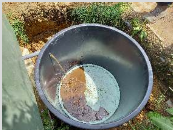
Odvodňovací box v činnosti