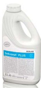
Sekusept PLUS 2 l láhev

Pro finální dezinfekci v rámci manuálního reprocessingu doporučujeme použití produktu Sekusept aktiv. V případě automatizovaného ošetřování nástrojů nabízíme systém SolidSafe. Další informace Vám poskytnou pracovníci společnosti Ecolab. Pro automatizovanou péči o flexibilní endoskopy je vhodné použití speciálních přípravků, např. výrobky Olympus.