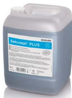
Sekusept PLUS 6 l kanystř