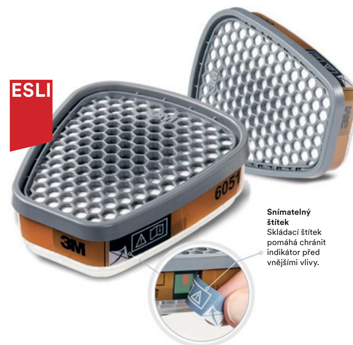
Snímatelný štítek Skládací štítek pomáhá chránit indikátor před vnějšími vlivy.

Prostředky na ochranu dýchacích orgánů řady 6000i s indikátorem doby použitelnosti jsou na trhu unikátní. Díky inovativnímu indikátoru doby použitelnosti 3M („end-of-service-life indicator“ – ESLI) mohou uživatelé ochranné polomasky měnit filtry tehdy, když filtry skutečně dosáhnou vyčerpání své kapacity. Vzhledem k tomu, že je systém vybaven indikačním barevným pruhem, je snadné zkontrolovat nasycenost filtrů; a tyto mohou být v provozu až do doby, kdy jsou schopné zachytit kontaminanty vytvořené v průběhu pracovní činnosti.